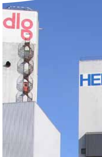
På Østre Havn skal havnebasin, kulturarv og nybyggeri skabe en ny tæt bydel.