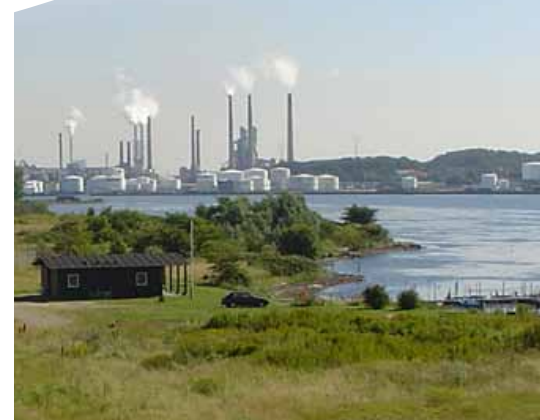
Stigsborgkvarteret i Nørresundby skal være et nyt attraktivt bykvarter med vægt på landskabet og fjorden som det identitetsskabende element.