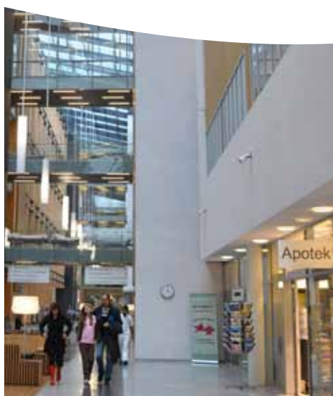
Universitetssygehuset giver et kæmpe løft til Aalborg Øst. Samarbejde med forsknings- og uddannelsesinstitutioner og samspillet med omkringliggende boliger, butikker og anden service giver området mulighed for ny dynamik.