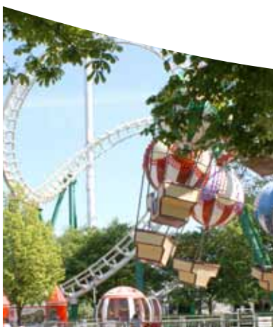
Forlystelsesparken Karolinelund afvikles og området omdannes til bypark. Det kan gøres på mange måder. Debatten om områdets fremtid igangsættes i efteråret 2011