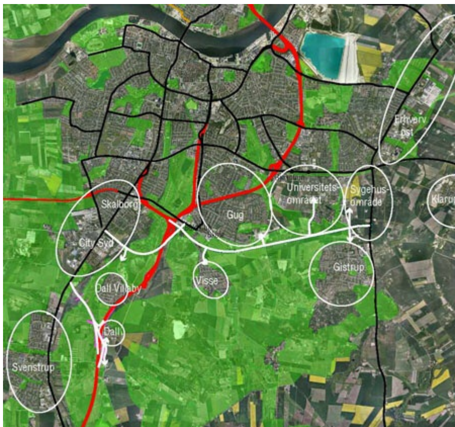
Vejanlægget i sammenhæng med det overordnede vejnet, den grønne struktur, og berørte byområder/funktioner.

Overordnet skaber det planlagte vejanlæg forbindelse mellem en række væsentlige byudviklingsområder i Aalborg, der forventes at ville rumme betydelige arealer til nye boliger og erhverv fremover.