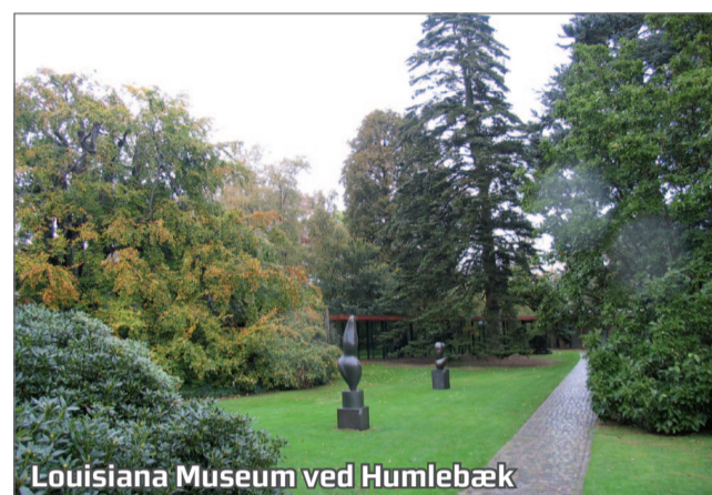
Louisiana Museum ved Humlebæk