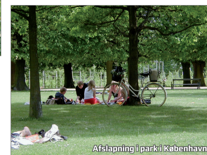
Afslapning i park i København