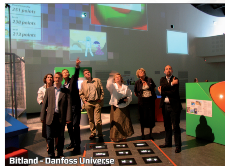
Bitland - Danfoss Universe