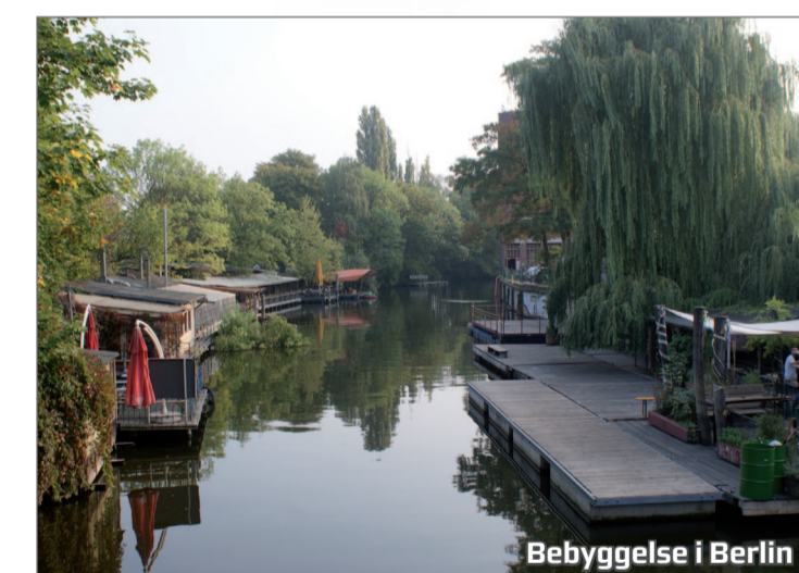
Bebyggelse i Berlin

Karolinelund er ca. 3,8 ha stort, og indtægten fra evt. grundsalg kan være med til at sikre, at der er økonomi til at indfri nogle af de mange ambitioner for området. Hvilken anvendelse, synes du, der skal gives mulighed for, og hvor skal bebyggelsen i givet fald placeres?