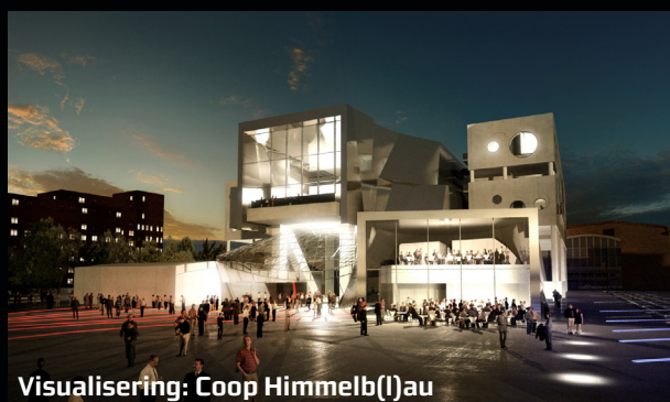
Visualisering: Coop Himmelb(l)au

Aalborg Midtby - herunder Karolinelund - er sammen med Kattegatkysten udpeget som oplevelseszone i kommuneplanen (skraveret på kortet). Kommuneplanen definerer oplevelseszoner som områder med en særlig koncentration og kvalitet af oplevelsesmuligheder, der desuden stiller gunstige betingelser til rådighed for gennemførelse af oplevelser (events) eller nye 'fyrtårne'/steder. Ved udformning af byrum, parker og forbindelser i oplevelseszoner lægges der særlig vægt på, at fysikken sammen tænkes med indholdet af det regionale byliv - fx kulturliv, shopping og events - og at der skabes en frugtbar balance mellem de forskellige anvendelser.