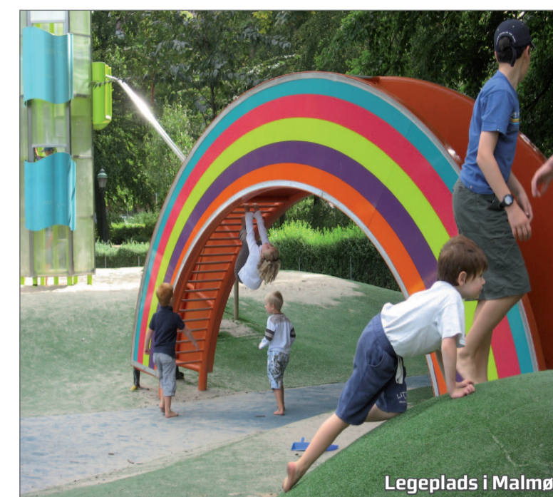
Legeplads i Malmø