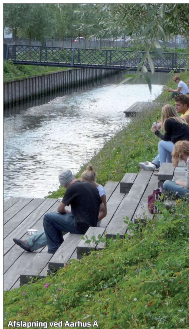
Afslapning ved Aarhus Å

Ordet er frit: Hvordan mener du, Karolinelund skal omdannes og anvendes i fremtiden?