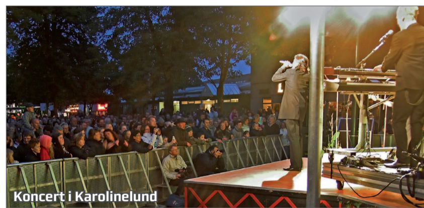
Koncert i Karolinelund