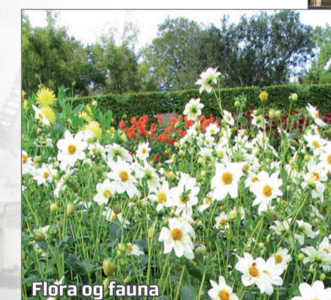
Flora og fauna