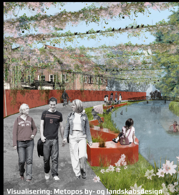
Visualisering: Metopos by- og landskabsdesign

Hvad er det efter din mening, der skaber en attraktiv storby? Hvordan kan omdannelsen af Karolinelund bedst underbygge visionerne om vækstaksen?