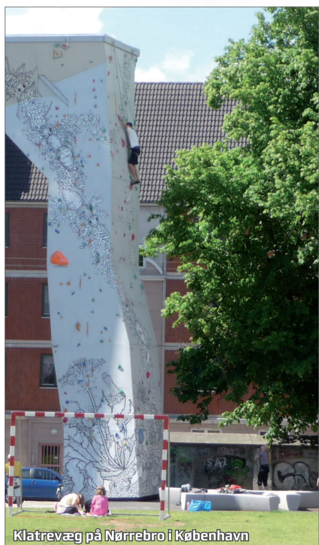
Klatrevæg på Nørrebro i København

Historisk set har Karolinelund været et sted, som tiltrak besøgende langvejs fra. Hvis man skal skabe de bedst mulige rammer for noget, der kan give liv hele året rundt - hvad kan det så være? Nye, spændende rammer for events, eller måske en ny attraktion på nationalt niveau, der kan spille sammen med Nordkraft, Utzon Center og Musikens Hus?