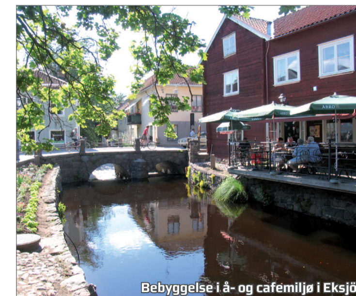
Bebyggelse i å- og cafemiljø i Eksjö