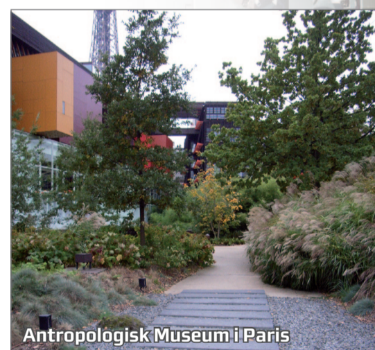
Antropologisk Museum i Paris