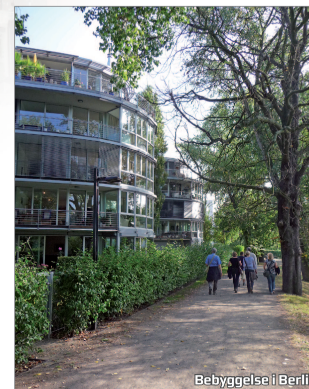
Bebyggelse i Berlin